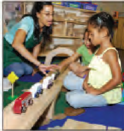
En prekindergarten, el maestro se toma el tiempo de evaluar los conocimientos y las competencias de los niños en un entorno auténtico. "Si quito un auto, ¿cuántos te quedan? ¿Cómo lo sabes?"